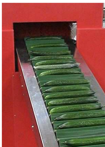
Alimentation (tapis + élévateur)

LIGNE COMPLETE DE CALIBRAGE ET DE CONDITIONNEMENT