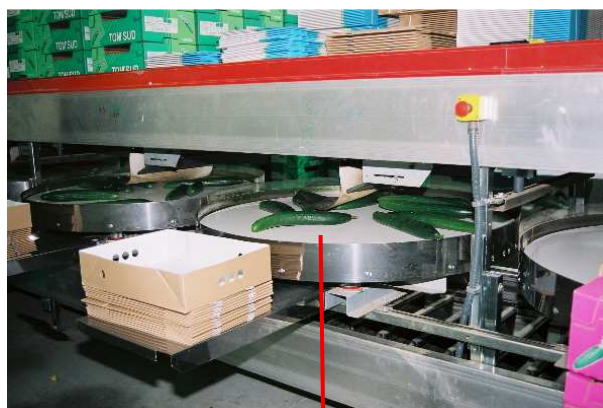
Réception des concombres sur table tournante